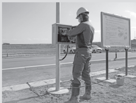
弁の作動状況を 地上で確認できる

近年は、震災対策用貯水槽の設置場所に変化が見られると話す。「従来の災害避難場所である学校や公園、官公庁の駐車場などに加え、道の駅への整備計画が増加傾向にあります。道の駅の防災機能を強化する国土交通省の方針に沿うもの