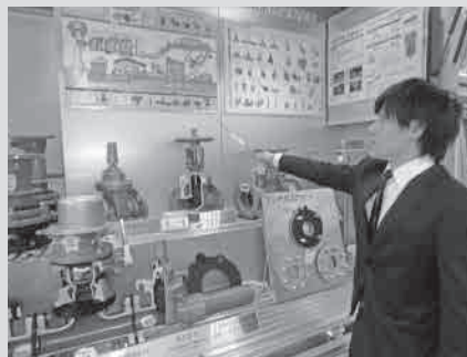
社内外問わず信頼される営業マン目指す

ラクエアの使い勝手の良さには秘密がある。「本製品は水道事業者の意見から開発したもので、使い手のニーズを細や