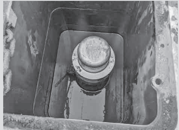
コンパクトな本体サイズ

今後の意気込みについて「当社は水道事業者のニーズを色濃く反映した完成度の高いオリジナル製品を数多くラインナップしています。お客様が抱える課題を深く理解し、最適な製品を的確に提案するお手伝いに粘り強く取り組むことで、社内外を問わず信頼される営業マンに成長したい」と語り、プロ意識を覗かせた。