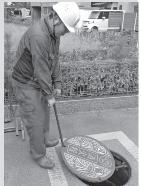
現場に急行しバルブの作動状況を確認

顧客に寄り添い、日々営業活動に取り組むなか、部門の垣根を超えた会社一丸での連携の重要性を強調する。「日頃から技術部門、生産部門とも緊密に情報交換し、スムーズに対応できる体制を構築しています」。さらに信頼を寄せられる理想の営業マンを目指し、今日も奔走する。